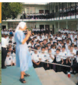
Scolari della scuola di Maracaibo gestita dalle Suore e dai Padri rosminiani