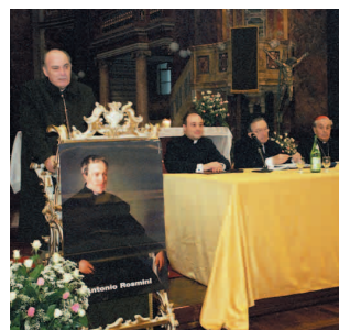
Convegno nella Basilica di S. Carlo in Roma in preparazione della beatificazione

particolari in campo apostolico. Rosmini insegna loro a mettersi davanti a Dio, senza condizioni per rispondere a qualsiasi chiamata alla CARITÀ. Oggi i segni dei tempi e l'esigenza della Chiesa ci stimolano ad un nuovo impegno nell'evangelizzazione della cultura, per rispondere alle tendenze del secolarismo e dell'individualismo, inevitabile conseguenza del tentativo di separare la libertà dalla verità, la fede dalla ragione. Con umiltà e fervore vogliamo rispondere all'appello che il Santo Padre ci ha personalmente rivolto: "indicare sentieri di libertà, saggezza e verità".