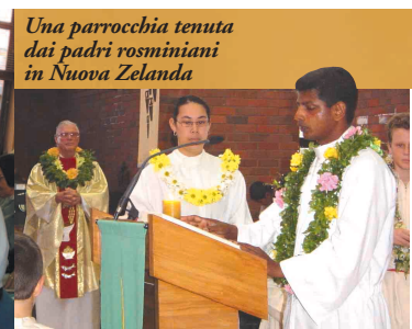
Una parrocchia tenuta dai padri rosminiani in Nuova Zelanda

risparmiato: dapprima nel fallimento dei progetti giovanili, entusiasticamente concepiti e avviati con i suoi compagni di università; poi nelle critiche che gli avversari hanno mosso al suo tentativo di rinnovare la cultura cattolica; più tardi nella