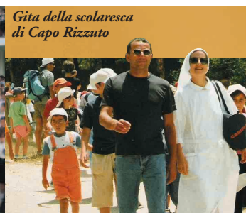
Gita della scolaresca di Capo Rizzuto