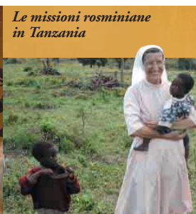
Le missioni rosminiane in Tanzania