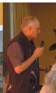
Un membro della Curia Generalizia dei Padri