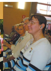
L'assemblea generale degli Ascritti della famiglia rosminiana